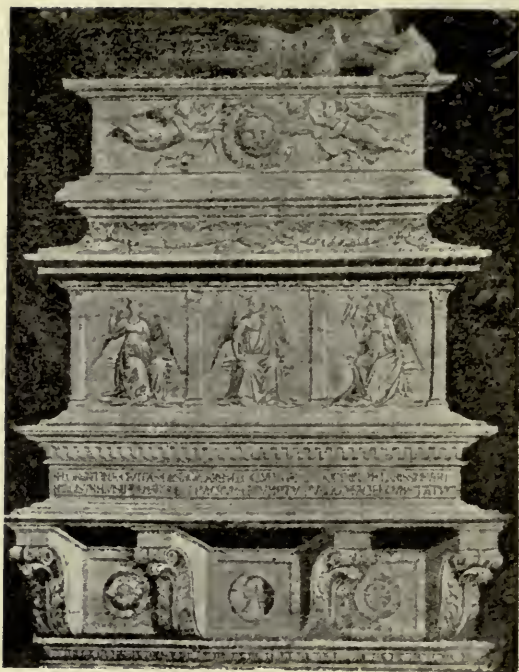
MONUMENTO A LUIGI MARSILI IN S. MARIA DEL FIORE